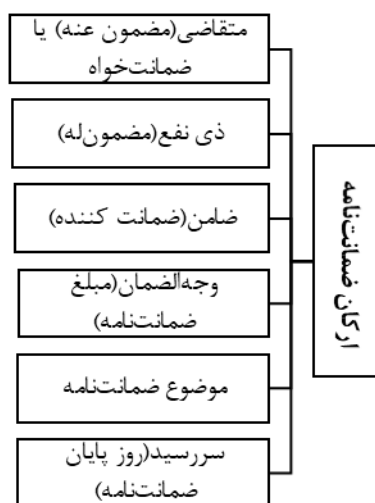
شکل ۳. مدت قراردادهای، مأخذ: نگارنده

تضمین‌ها در قراردادهای پیمانکاری به صورت مشروط یا بی‌قید و شرط مقرر می‌شوند. در تضمین مشروط، کارفرما در صورتی می‌تواند وجه تضمین را مطالبه کند که بتواند تخلف پیمانکار را اثبات نماید. برخی از تضمین‌ها نیز به صورت بی‌قید و شرط مقرر می‌شوند که به موجب آنها شخص ثالث متعهد می‌گردد به محض مطالبه کارفرما از عهده پرداخت برآید و اثبات تخلف پیمانکار، شرط مطالبه تضمین نیست. (کاظمی نجف‌آبادی، بیات، ۱۳۹۴).